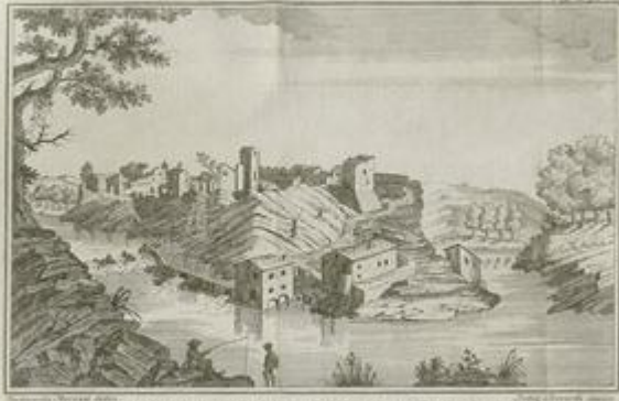
Veduta del Castello di Giove e Strada della Chiassa in Arno